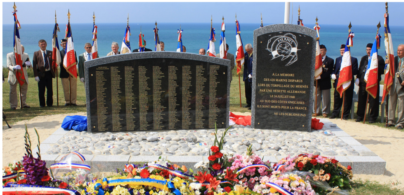
75 ans après le torpillage du Meknès plusieurs cérémonies vont rendre hommage aux 420 victimes de ce drame.

Sans escorte, le Meknès navigue avec ses feux de position allumés et brillamment éclairé,