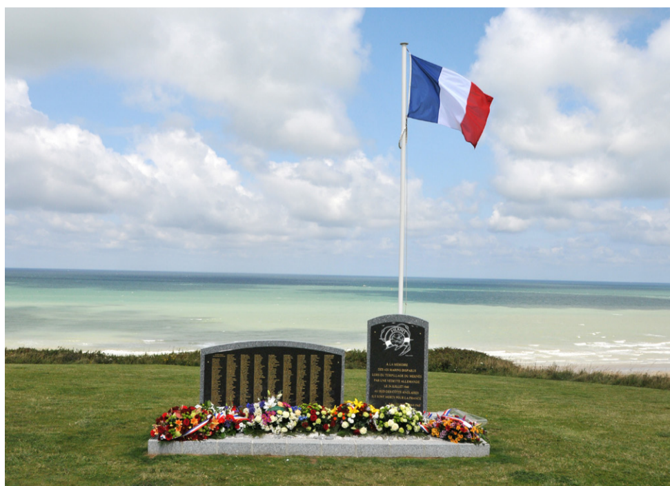
Face à la mer, sur les falaises de Berneval/Saint-Martin la stèle a inscrit dans le marbre ce drame de la seconde guerre mondiale.