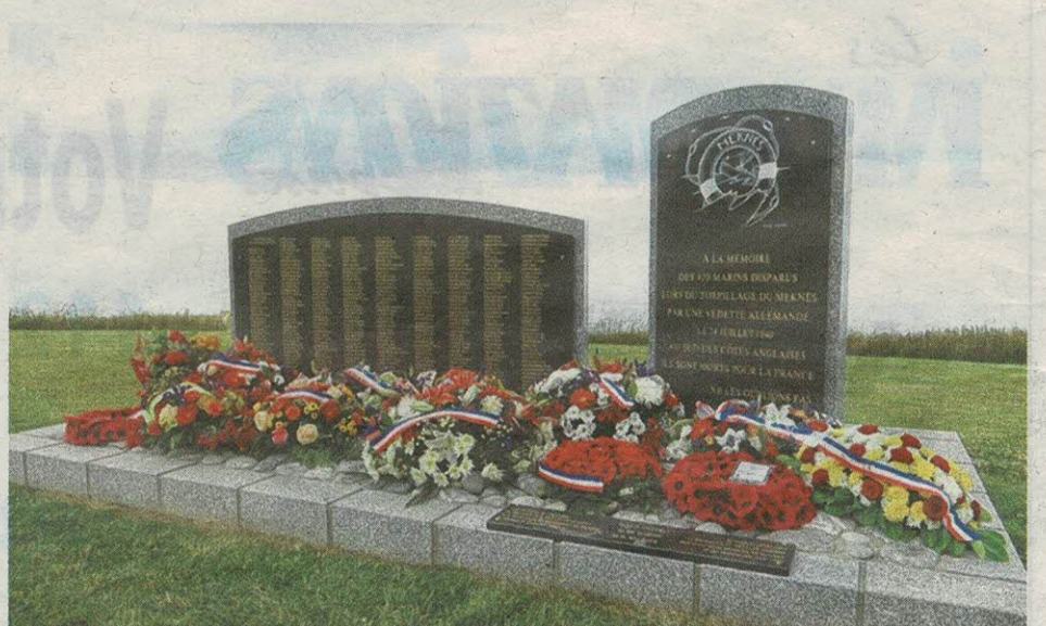
Un monument a été érigé à la mémoire des disparus sur les falaises de Berneval et Saint-Martin-en-Campagne. C'est là que se tiendra la cérémonie mardi 24 juillet.