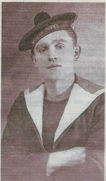
Certains membres d'équipage étaient de tout jeunes hommes.

sirène. Pourtant, cinq minutes plus tard, sans aucune sommation, le Meknès est torpillé par