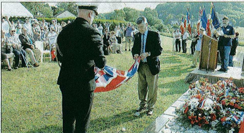
Une plaque en l'honneur des aviateurs disparus a été dévoilée.

Pendant la commémoration, des gerbes de fleurs ont été déposées devant la stèle. Puis le traditionnel appel aux morts a été fait par les proches des victimes. Enfin, La Marseillaise et le God Save the Queen ont retenti dans les airs avant un lâcher de pigeons.